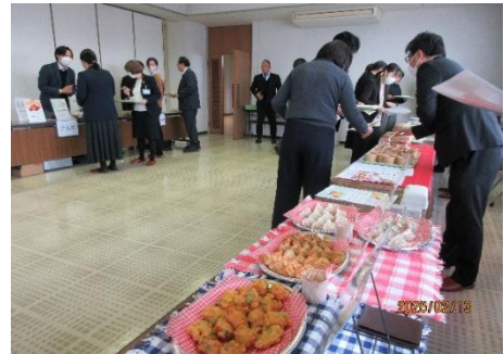
(物資委員会の試食の様子)